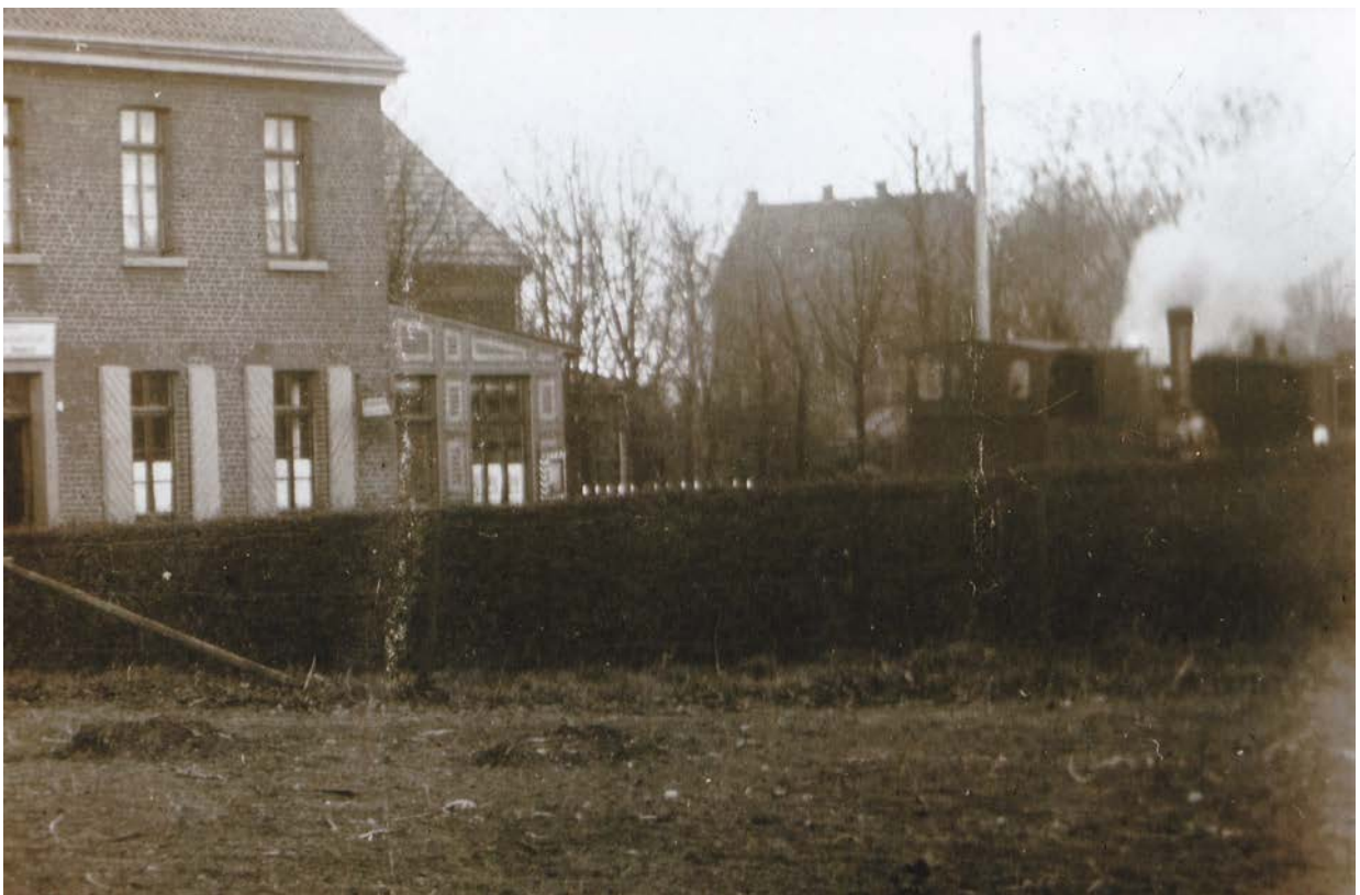
Der Puffer kommt von Heiligenhaus und fährt in die Haltestelle „Boltenburg“ ein (1910)

Dieser Aufsatz wurde in einer hiesigen Schule unter Aufsicht selbstständig angefertigt. Treffender konnte Kindermund unsere Dampfbahn nicht schildern.