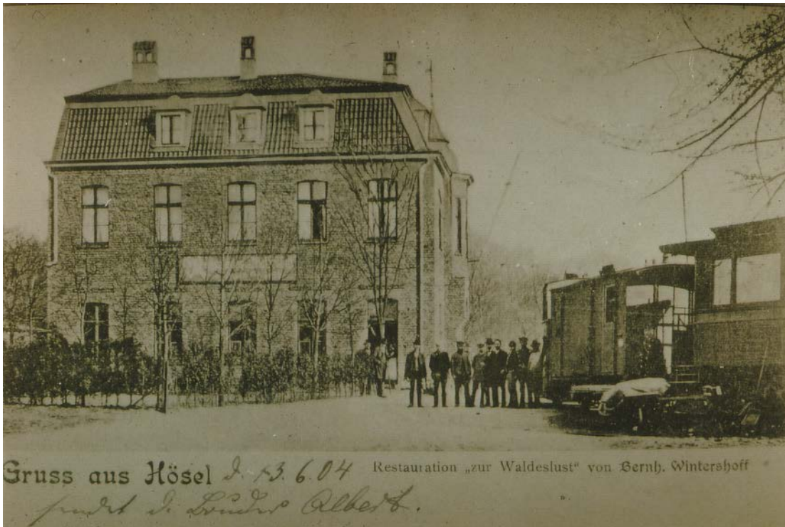
1904: Die Post wird am Endbahnhof Hösel aus dem „Puffer“ entladen

Der Gütertransport von Heiligenhaus nach Hösel bestand in erster Linie aus Fertigprodukten der Schloss- und Beschlägeindustrie, die hier umgeladen wurden.