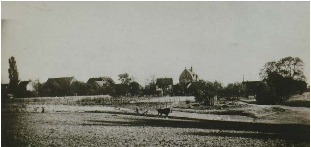
1930: Blick auf das dörfliche Hösel von der heutigen Straße „Am Neuhaus“ aus gesehen. Lins: deutlich zu sehen der Bahndamm der Kleinbahn. Im Hintergrund: die Gaststätte Boltenburg, das Fachwerkhaus am Graben und die kath. Schule

Die Bahnlinie verlief zunächst vom Endbahnhof Hösel parallel der Bahnhofstraße auf dem Fuß- und Radweg bis zur Hugo-Henkel-Straße. Nach einer Rechtskurve ging es dann hinter den Häusern Kohlstraße 2-8 bis zur Kreuzung der Kohlstraße mit der Rodenwaldstraße. Hier war die zweite Haltestelle „Schlipperhaus“. Die heutige Wolf-von-Niebelschütz-Promenade ist noch der Original-Bahndamm bis zur Bismarckstraße. Im Gebiet der jetzigen Wohnanlage „Adelsgarten“ gab es um das Jahr 1900 ergiebige Bausandvorkommen, die über einen Gleisanschluss von der Kleinbahn abtransportiert wurden. Etwa im Bereich des Hauses Bismarckstraße 47 fuhr die Kleinbahn dann über eine Rechtskurve durch einen Geländeeinschnitt hinter der früheren Gaststätte „Haus Waldeck“ über einen eigenen Bahndamm im Verlauf der heutigen Straße „Am Graben“ bis zur Eggerscheidter Straße. Hinter der alten Scheune der Gastwirtschaft „Boltenburg“ und nach einer scharfen Linkskurve (Radius: 28 Meter) bog der „Puffer“ in die dritte Haltestelle „Stinshoff“ ein. Weiter lagen die Gleise über die Eggerscheidter Straße. Bei der damaligen Gaststätte „Zum Stern“ von Karl Stichmann (ab 1912 Wilhelm Bergbusch) kreuzte sie die Bahnhofstraße und fuhr auf der linken Straßenseite der Heiligenhauser Straße bis zur letzten Haltestelle von Hösel „Am Bruch“.