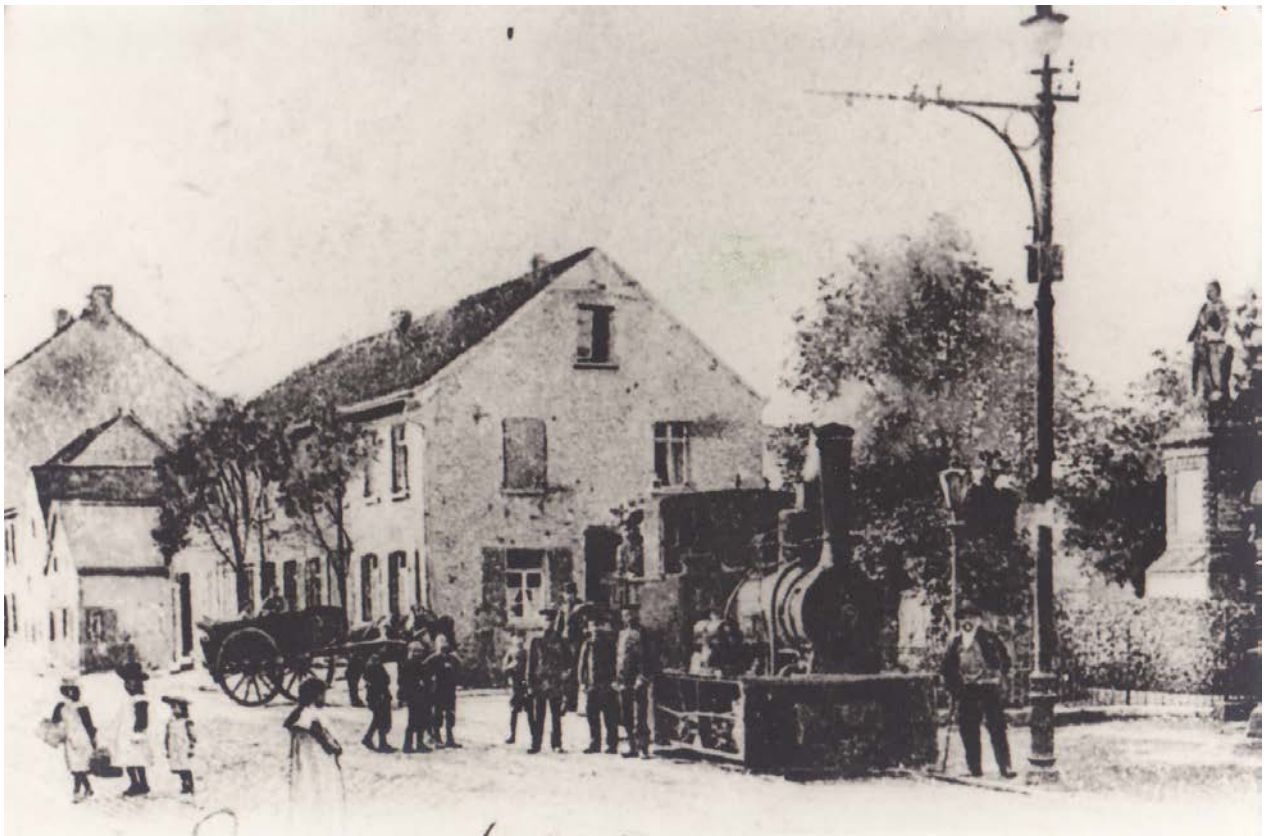
Die Lokomotive der Bergischen Kleinbahn um 1903 in Heiligenhaus am „Denkmal“ (heute Rathaus)

Der Streckenbeginn in Hösel war da, wo sich heute das 1996 fertiggestellte Parkdeck befindet. Hier waren ein Lokomotivschuppen und mehrere Abstell- und Ladegleise, auch zum Güterschuppen, eingerichtet worden. Das Ladegleis verlief parallel zum Gleis der Königlich-Preußischen Eisenbahn. Von hier wurden alle Güter insbesondere Kohlen, für die vielen Dampfmaschinen, die in den Heiligenhauser Fabriken als Antrieb für den umfangreichen Maschinenpark dienten, von Hand in die Waggons der Kleinbahn geschaufelt.