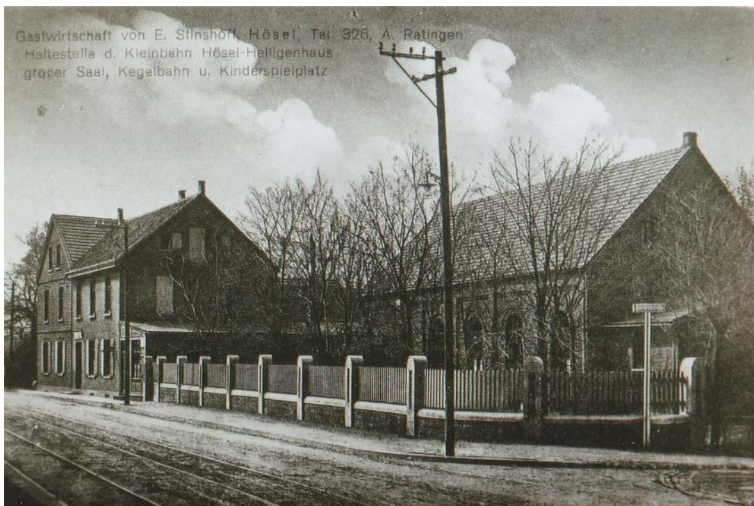
Die Boltenburg 1910. Im Vordergrund die Gleise der Kleinbahn. Am Mast die erste Straßenlampe in Hösel (1908)